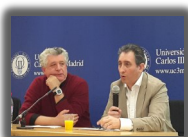
▶ PORIB UC3M