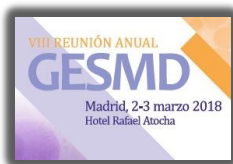
► PORIB VIII Reunión GESMD