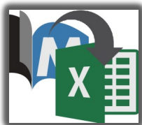
► PORIB REVTool