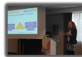
► PORIB Formación