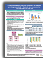
► PORIB Publicaciones