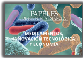
► PORIB Papeles de Economía Española