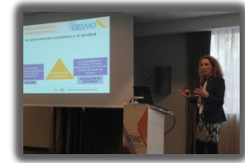
► PORIB Formación