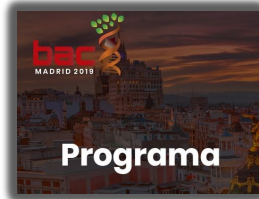
► PORIB Biotecnología en España