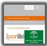
► PORIB y ACSA