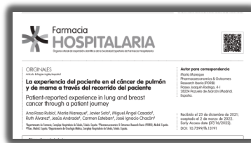
► PORIB Artículos