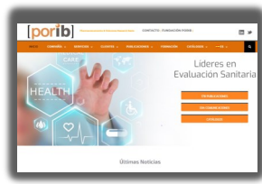
► PORIB lanza su nueva página web