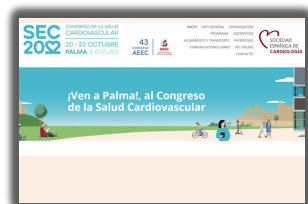
► PORIB candidata a premio de la SEC