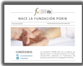
► Nace la Fundación PORIB