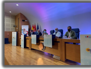
► PORIB Proyecto concienciación adherencia