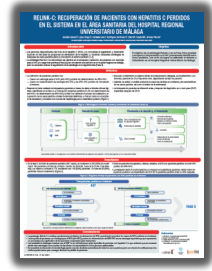
► PORIB Comunicaciones