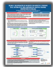
► PORIB Comunicaciones