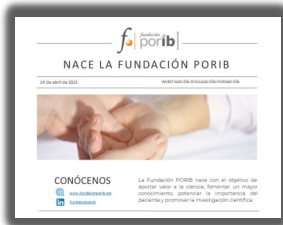
► Nace la Fundación PORIB