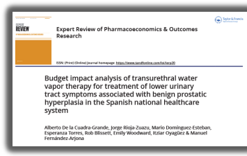
► PORIB Artículos