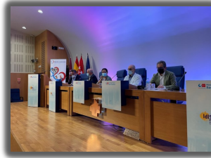
► PORIB Proyecto concienciación adherencia